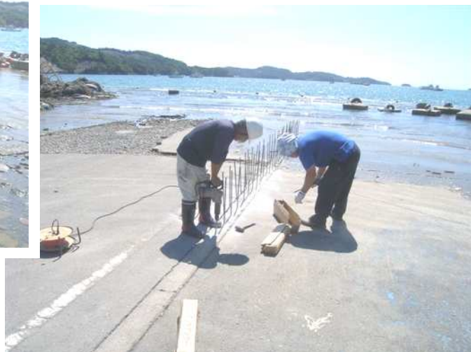
仮設の栈橋を建設する工事 スタートです。