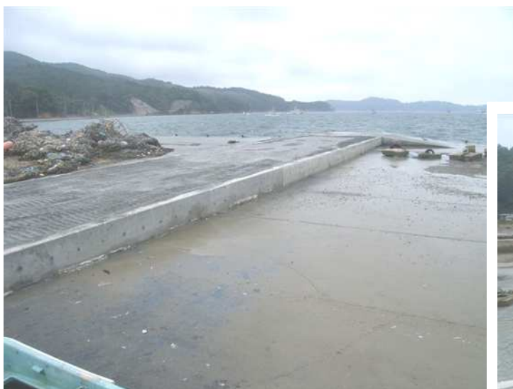
できあがりつつある栈橋