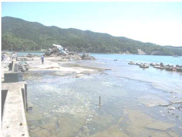
沈下してしまった漁港 宮城県石巻市 小網倉浜漁港です。