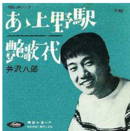
レコードのジャケット

さて、歌手「井沢八郎」の話に戻そう。「あゝ上野駅」は昭和39年東京オリオンピククの年のヒット曲だが、この歌は関口義明が上野駅で見かけた集団就職の少年達を題材に詞を書き農家向け家庭雑誌「家の光」の懸賞に応募し一位入選となり東芝レコードがレコード化。当時ほとんど無名だった井沢八郎が歌ったのが評判を呼び人気箇所の仲間入りをする事になる。歌手を志して青森県から単身上京した井沢自身の人生も重なり発売後まもなく「金の卵」と呼ばれた集団就職者などから支持と共感を得て高度成長期の世相を描いた代表的なヒット曲となった。