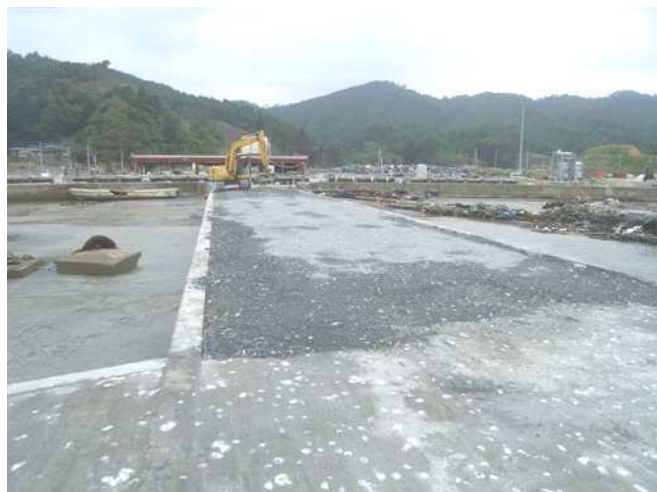
栈橋の先端から陸地方向を見る